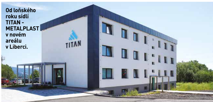
Od loňského roku sídlí TITAN - METALPLAST v novém areálu v Liberci.