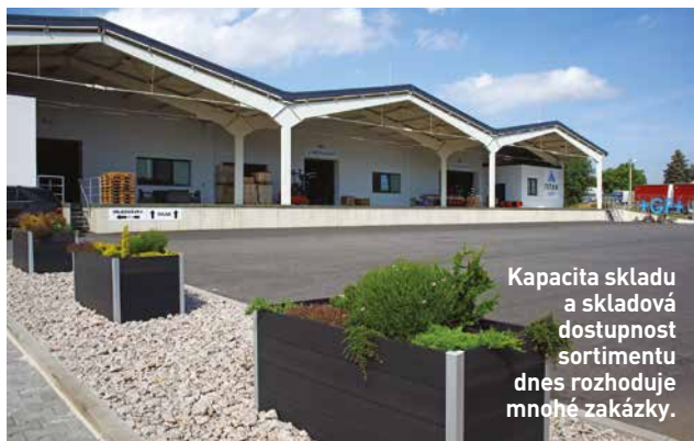
Kapacita skladu a skladová dostupnost sortimentu dnes rozhoduje mnohé zakázky.

Náročné to je, konkurence nespí. S některými konkurenčními výrobky cenově soutěžit nemůžeme, nicméně je dokážeme